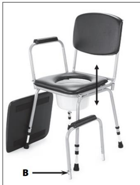
odstranitev naslona za roke