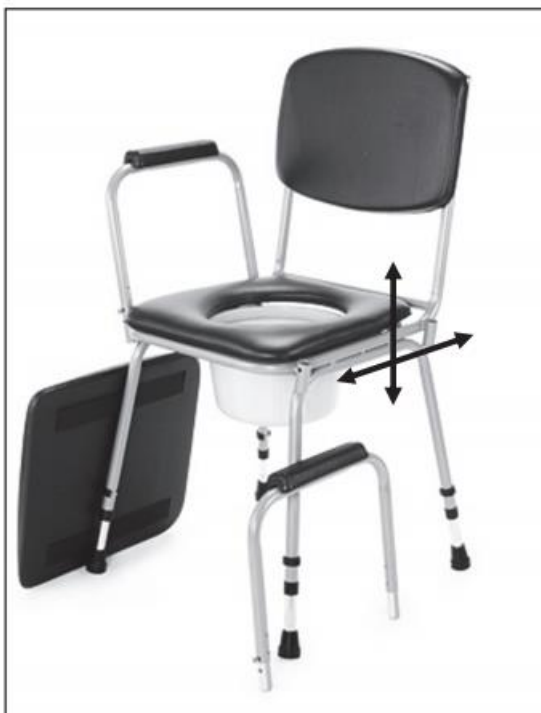
odstranitev / vstavitev plastične posode

Pred uporabo stola najprej odstranite oblazinjeno sedalo in pokrov posode. Plastično posodo odstranite od zadaj, ali pa dvignite sedežni obroč. Za udobnejše sedanje pritisnite varovalko B in odstranite naslon za roke.